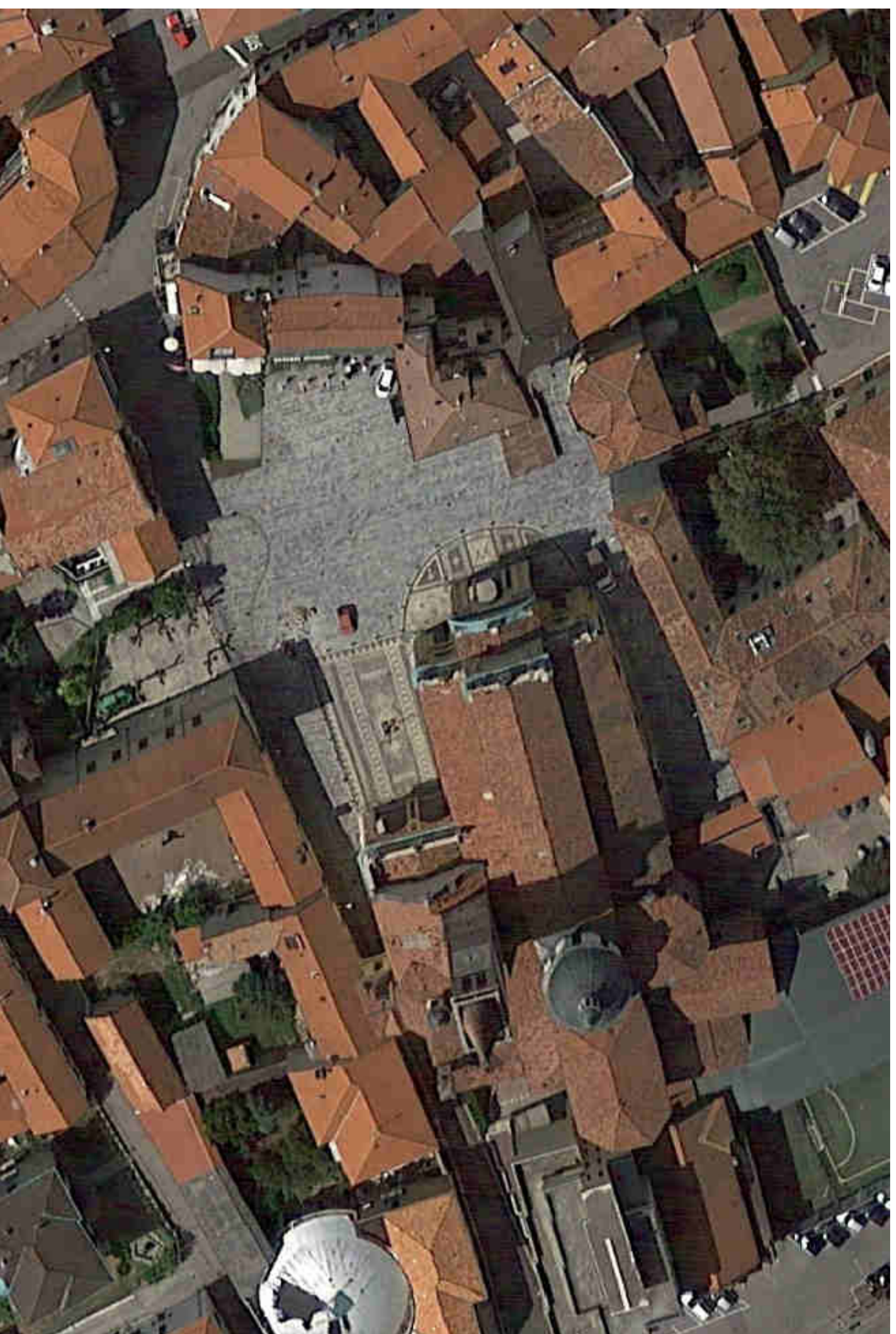
AEROFOTO scala 1:1000