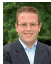
di Sergio Costato L'Assessore all'Ambiente